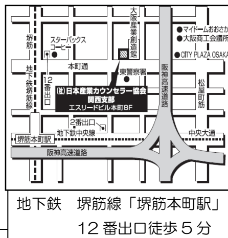
地下鉄 堺筋線「堺筋本町駅」 12番出口徒歩5分